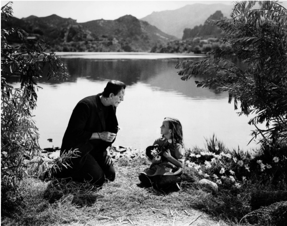
Fotograma de Frankenstein (1931), de James Whale.

Observeu atentament el fotograma següent de la pel·lícula Frankenstein (1931), de James Whale, i responeu a les qüestions 2.1, 2.2 i 2.3.