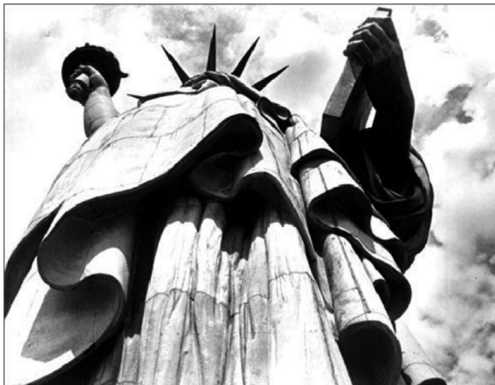
The Statue of Liberty , Margaret Bourke-White, 1930.

Observeu atentament la fotografia següent, obra de la fotògrafa Margaret Bourke-White, i responeu a les qüestions 2.1, 2.2 i 2.3.